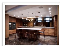
Anchor Brehouse Thomsonkitchen2