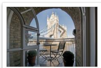
Anchor Brehouse balcony