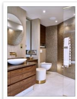
Anchor Brehouse Thomsonbath3