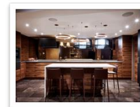
Anchor Brehouse Thomsonkitchen3