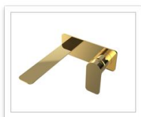
Anchor Brehouse sento oro lucido 2397350

finition et de galvanisation, GRAFF utilise un système de rejet zéro qui recycle 100% du laiton et du papier. Conformément à l'engagement fort en matière de durabilité environnementale, les produits Sento sont parmi les plus durables de la société américaine, l'une des premières sociétés au monde à avoir publiquement exprimé sa volonté de contribuer réellement à l'élimination de leur impact sur l'environnement en le futur proche.