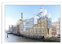
Anchor Brehouse img